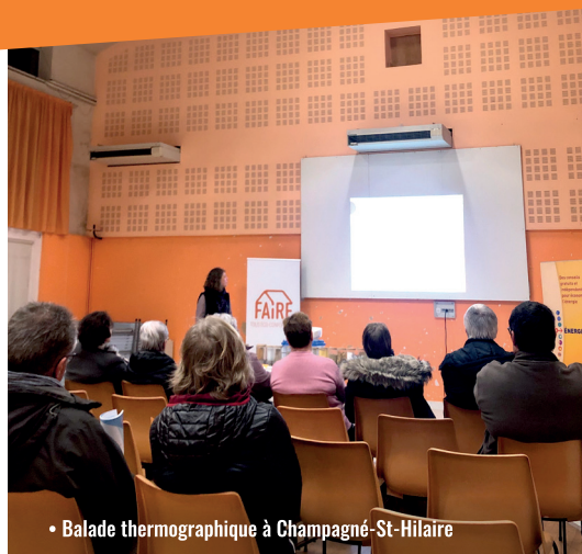
• Balade thermographique à Champagné-St-Hilaire

CIVRAISIEN EN POITOU Communauté de communes