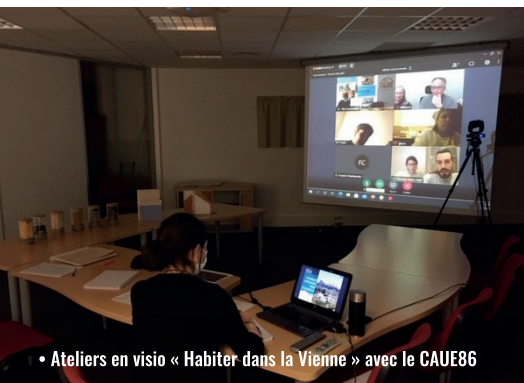
• Ateliers en visio « Habiter dans la Vienne » avec le CAUE86