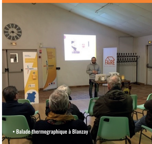
• Balade thermographique à Blanzay